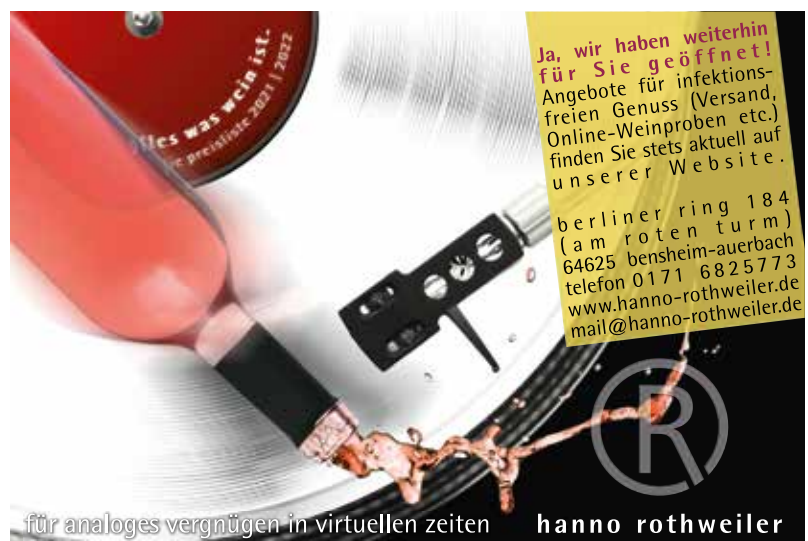
für analoges vergnügen in virtuellen zeiten hanno rothweiler

Corona habe im Weinbau trotz vieler Probleme auch einen Denkprozess ausgelöst und den Blick auf alternative Ideen und neue Perspektiven eröffnet, so Hanno Rothweiler. „Kreativität und Weitblick waren schon immer wichtig. Jetzt vielleicht umso mehr.“ tri