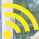
Familie Rußmann GGEW-Kunden aus Bensheim

JETZT VORTEIL SICHERN: GGEWINNER-KOMBI.DE ZUSÄTZLICH 3 MONATE KOSTENLOS waipu .tv