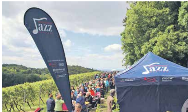
Ein Höhepunkt des Bergsträßer Weinfrühlings: die Weinlagenwanderung. Unser Bild entstand oberhalb des Fürstenlagers.

Der Startschuss erfolgt beim Bergsträßer Weintreff am 27. April. Was in den Kellern der Winzer reift wird in diesem Jahr aufgrund der Sanierungsarbeiten allerdings nicht im Bensheimer Bürgerhaus sondern erstmals ab 15 Uhr in der Mensa der Karl-Kübel-Schule vorgestellt. Eine einmalige Gelegenheit rund 180 Bergsträßer Weine, Seccos und Sekte von nahezu allen Winzern der Hessischen Bergstraße vergleichend miteinander zu verkosten. Als Gastwinzer konnten die Organisatoren in diesem Jahr die Felsengartenkellerei Besigheim eG aus Hessigheim gewinnen. Mehr als 1600 Mitglieder zählt die Winzergenossenschaft, welche zusammen rund 640 Hektar Rebfläche bewirtschaftet. Hierbei dominieren „die Roten“ deutlich.