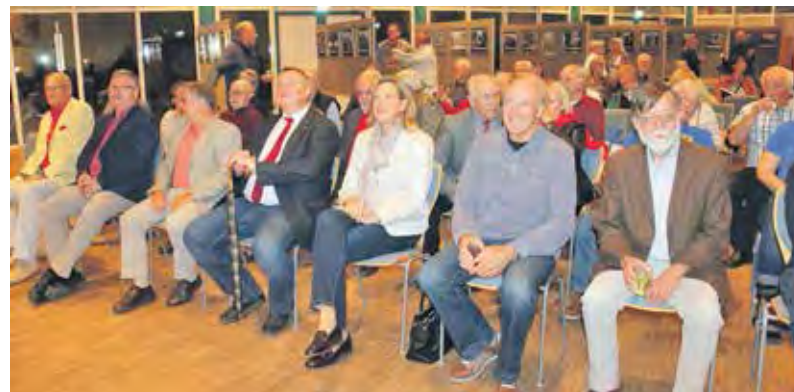
Von den Römern bis zur Neuzeit. Mit seiner traditionellen Kerweausstellung ließ der Auerbacher Kur- und Verkehrsverein Mitte Oktober die Geschichte der Bachgasse wiederaufleben. Mehr als 40 alte Bilder wurden im Bürgerhaus Kronepark aktuellen Fotografien unter dem Motto „Einst und Jetzt“ gegenübergestellt und unterstrichen hierdurch anschaulich den Wandel von Auerbach und seiner im Ortskern gelegenen geschichtsträchtigen Straße.

Der Auerbacher zum Downloaden www.der-auerbacher.de oder einfach QR-Code scannen nächste Ausgabe am 1. Dezember