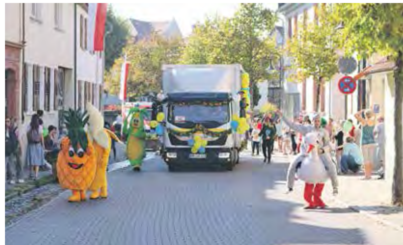
Höhepunkt der Auerbacher Kerb: der sonntägliche Festzug. Unser Bild zeigt den Beitrag vom Auerbacher EDEKA Merz.

Wiederum hervorragend besucht war der obligatorische Frühschoppen am Kerwemontag mit „Musik Tom“. Für Abwechslung sorgten zudem ein Schätzspiel über die Gesamtgröße mit Zylinder und Krone der Traditionsfiguren und nicht zuletzt am Nachmittag die Kindervorstellung des mobilen Marionettentheaters „Tri Tra Trulalla“. Ein Jahr auf die nächste Kirchweih warten hieß es schließlich beim Seniorennachmittag der Arbeiterwohlfahrt am Dienstag, in dessen Rahmen nach dem nochmaligen Vortragen der „Kerweredd“ der geschmückte Kerwekranz wieder herabgelassen wurde.