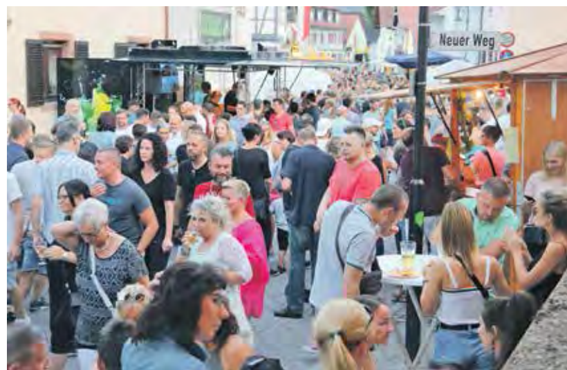
Gut besucht war Mitte Juli insbesondere in den Abendstunden das bereits 32. Auerbacher Bachgassenfest.

Etwas einstimmen für das Endspiel der Fußball-Weltmeisterschaft konnten sich Besucher am Sonntagnachmittag unter anderem beim klassischen Torwandschießen „in der Gass“ oder auch mit der Teilnahme bei einem Tippspiel des Auerbacher Gewerkekreises bei ihrem verkaufsoffenen Sonntag auf der B3. Auch in diesem Jahr hatten sich die Geschäftsleute wieder einige Aktionen zum Sonntagshopping einfallen lassen. Die Gewinner des Tippspiels konnten ihre Preise übrigens beim Public Viewing auf der Terrasse vom Parkhotel Krone entgegennehmen.