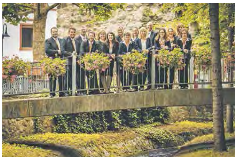
Regional verwurzelt. Die ausgezeichneten Mitarbeiterinnen und Mitarbeiter der Volksbank in Bensheim.