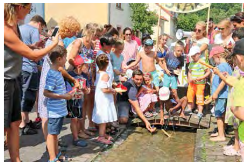
Von Beginn an dabei ist die bei den jüngsten Besuchern beliebte Bachregatta mit erneut rund 150 selbstgefertigten Schiffchen.