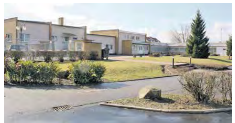
Geschichte ist bereits die Perspektive auf die alten Umkleidegebäude im südlichen Bereich des Weiherhausstadions (Bild unten). Unmittelbar davor wird aktuell ein Sportfunktionsgebäude gebaut. Nach dem Abriss der alten Gebäude entstehen auch weitere dringend benötigte Pkw-Stellplätze für Pkw und Fahrräder.